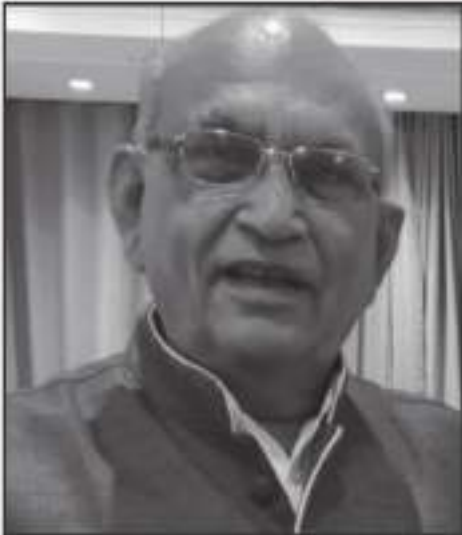
નરશી કરસન પરબત કુરીયા લાકડીયા

ઉદારતાપૂર્વક અપાયેલ અનુદાનની અંતરથી અનુભોદના